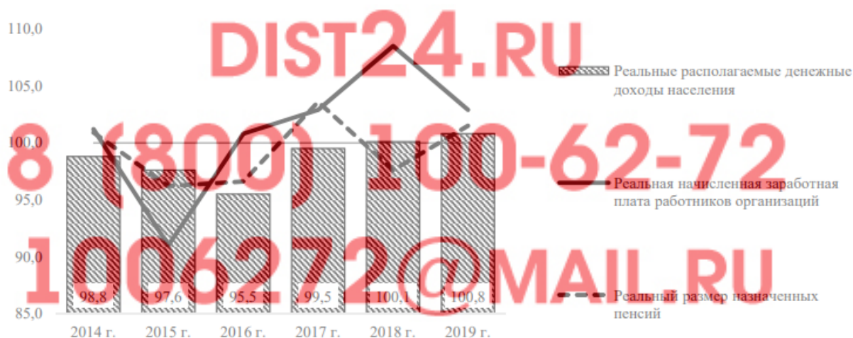
Рисунок 1. Динамика реальных располагаемых денежных доходов населения, реальной начисленной заработной платы и реального размера назначенных пенсий в 2014–2019 гг., в % к предыдущему году

Ситуация, которая сложилась в нашей стране в социальной сфере, не позволяет в настоящее время обеспечить достойное существование различных групп населения. В 2019 г. реальные располагаемые денежные доходы населения увеличились на 0,8% относительно аналогичного периода предыдущего года, реальная начисленная заработная плата – на 2,9%, а реальный размер назначенных пенсий – на 1,5% (рис. 1) 1 .