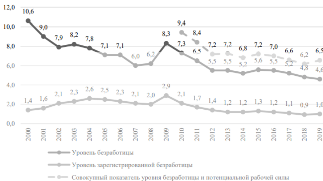
Рисунок 4. Динамика безработицы, %

населения за год в расчете на 100 вакансий увеличилась на 1 безработного и составила 54,4 представителя данной категории 1 .